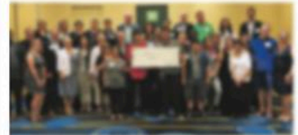
Les membres du Groupe Banque TD et de la Fondation Light a Dream, le 26 septembre dernier.

Le Groupe Banque TD a donné 3 000 $ à la Fondation Light a Dream, un organisme de bienfaisance axé sur la lutte contre le chômage des jeunes adultes ayant des besoins particuliers de se familiariser avec le marché du travail, et de renforcer leur autonomie et leur estime personnelle.