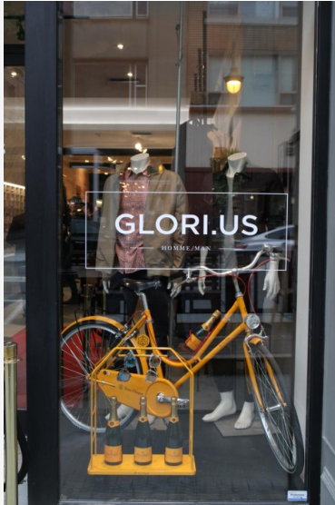
La boutique mode Glori.us à Sherbrooke