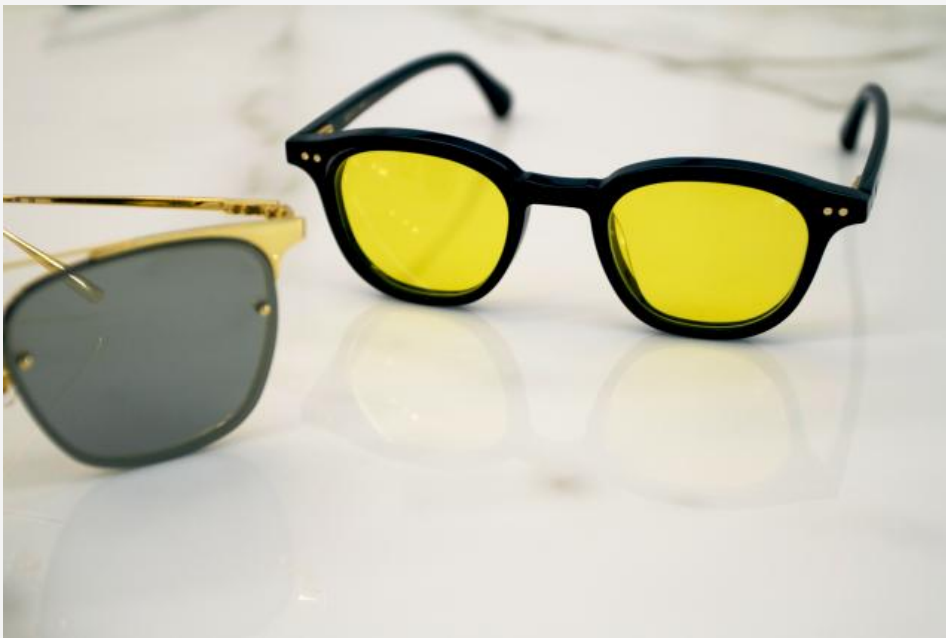
Un des produits Gentle Monster de Lunetterie Générale

«Pour devenir une référence haut de gamme en lunetterie, il faut d'abord reconnaître ses forces et ses faiblesses. C'est pourquoi nos montures en acétate sont entièrement fabriquées au Japon. Et c'est mieux ainsi. L'expertise des Japonais en optique ne date pas d'hier et leur qualité est reconnue mondialement. Ça devient une lubie de croire que nous pourrions faire mieux qu'eux.»